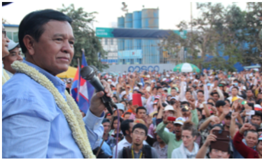
Image: Kem Sokha encourage les votants à rejoindre les manifestations 12