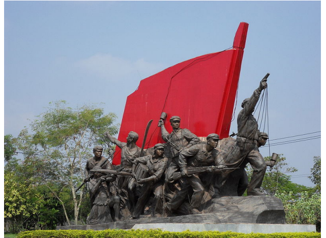
Un des deux groupes monumentaux à l'extérieur du musée Kaysone Pomvihane de Vientiane, au Laos

D'ici 2021, une vingtaine de trains de voyageurs et de marchandises devraient circuler chaque jour sur le réseau laotien, entre 120 et 200 km/h. Vingt-et-une gares ont été prévues dans un premier temps, dont celle de l'ancienne capitale royale inscrite à l'inventaire des sites du patrimoine mondial de l'Unesco, Luang Prabang.